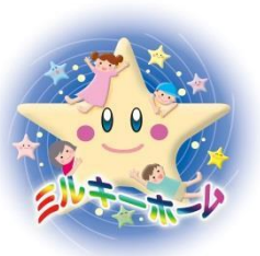
ミルキーホームグループ

ミルキーホーム もねの里 〒284-0016 四街道市もねの里5-19-5 TEL 043-424-0055 FAX 043-424-0035